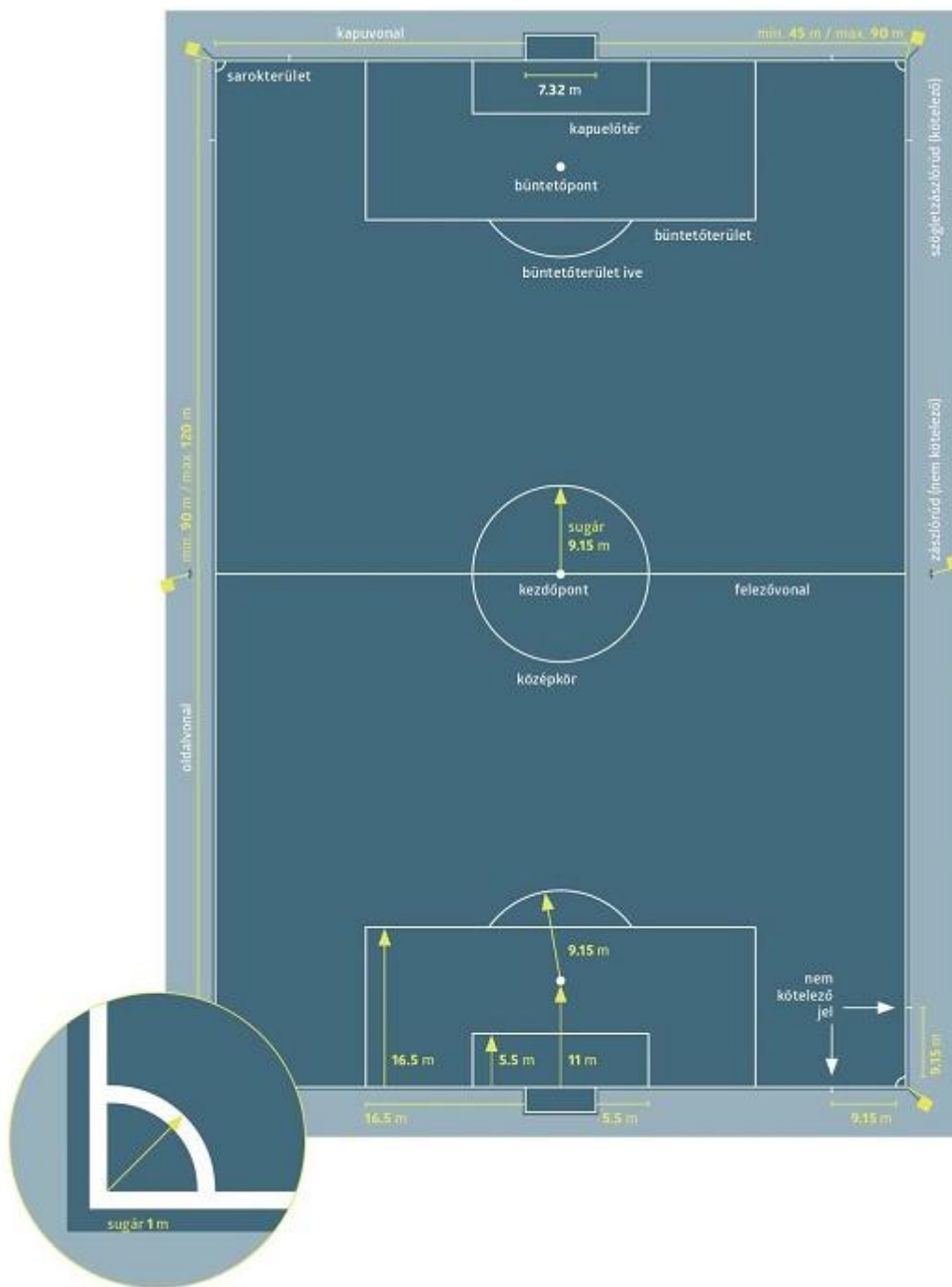
1. ábra A játéktér